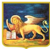
PATROCINIO REGIONE DEL VENETO