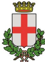
Comune di Padova